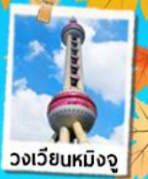
วงเวียนหมิงจู่