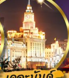
เดอะมันด์