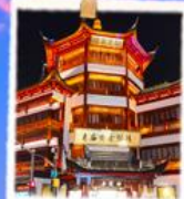
ตาด 100 ปี