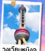
วงเวียนหมิงจู่