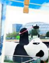
แพนด้าเซลฟี่