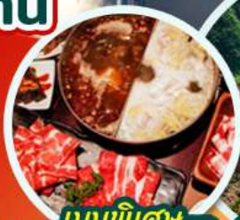
เมนูพิเศษ ชาบูหม่าล่า