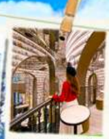
ร้านหนังสือ