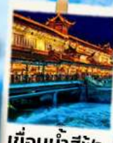
เขื่อนน้ำสีฟ้า