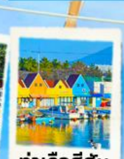
ท่าเรือสีสัน