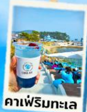
คาเฟ่ริมทะเล