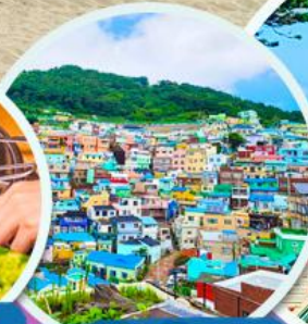
หมู่บ้านคัมซอน