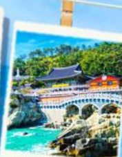
วัดริมทะเล