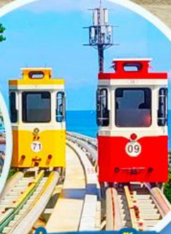
นั่งรถไฟปู๊กบีก

ราคานี้รวมค่าภาษีน้ำมัน + ค่าภาษีสนามบิน ** ปรับขึ้น ณ วันที่ 1 เม.ย. 69 เรียบร้อยแล้ว **